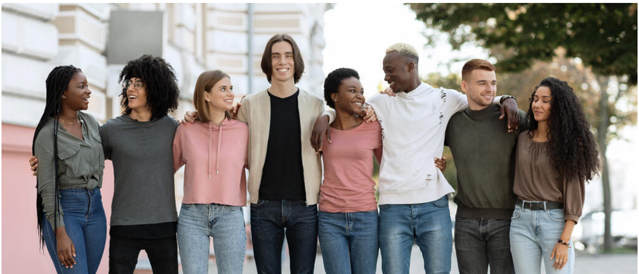
Vielfalt schätzen - Miteinander leben