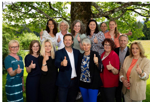
Team der Staatlichen Schulberatungsstelle für Oberbayern-West