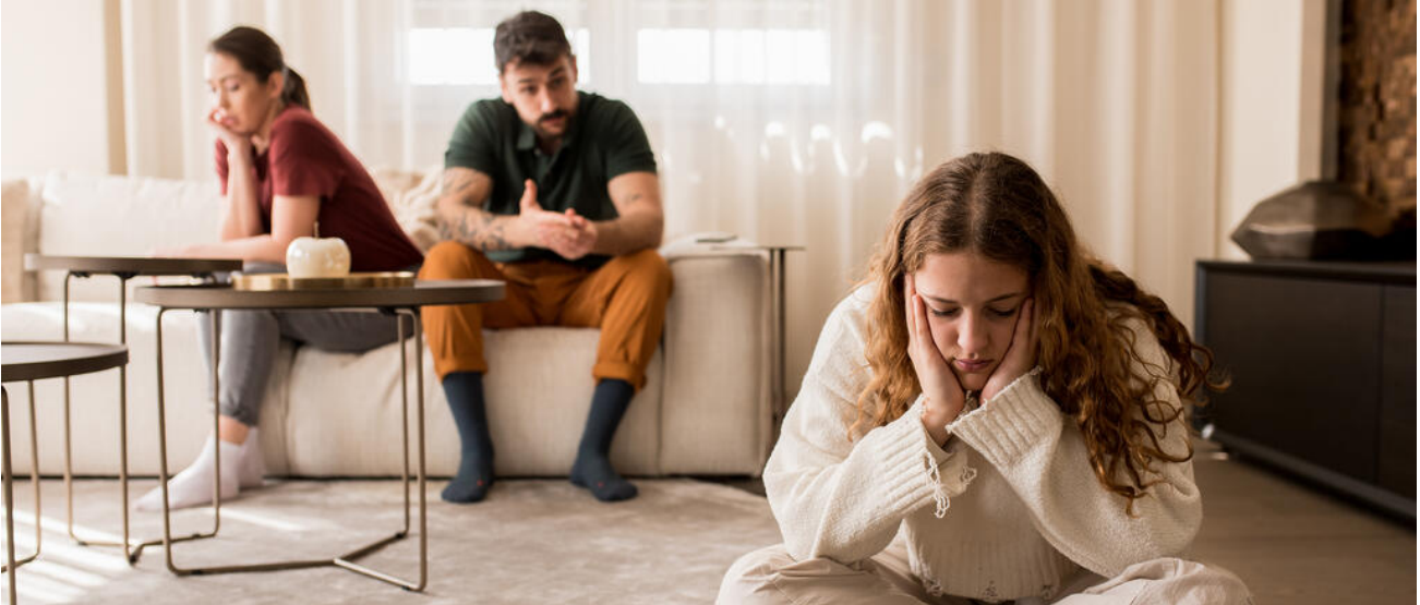
Kinder mit Auffälligkeiten im Erleben und Verhalten brauchen individuelle Lösungen

Auffälligkeiten im Erleben und Verhalten können verschiedene Formen und Ausprägungen zeigen und erfordern individuelle Maßnahmen.