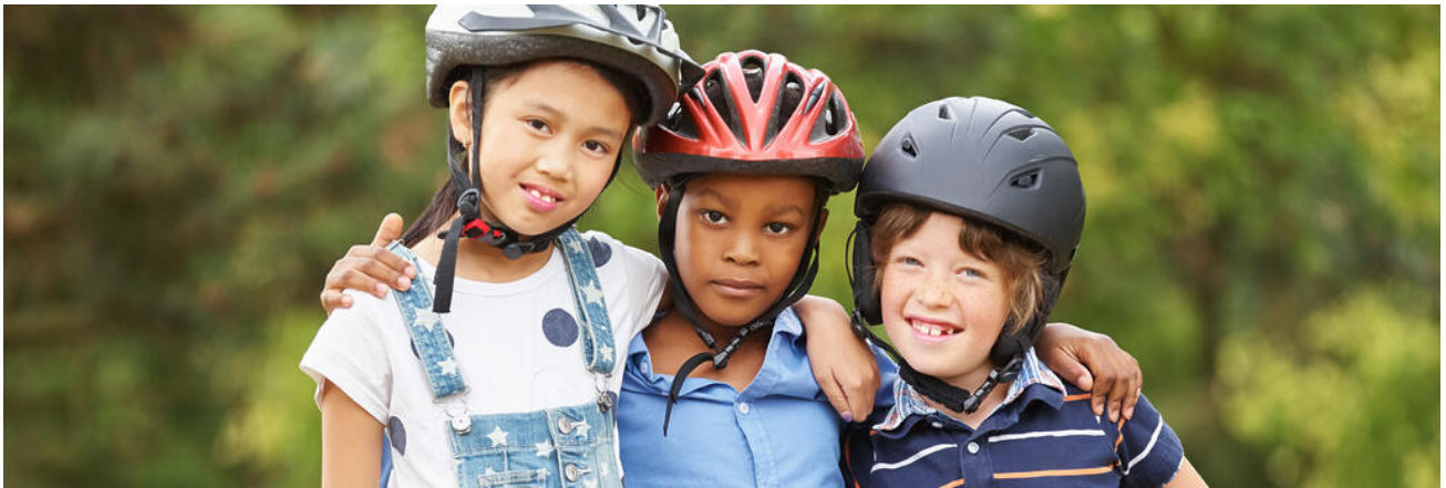
Ein Helm schützt vor Kopfverletzungen

Zu Fuß, mit dem Fahrrad, dem Roller oder dem Schulbus: Schülerinnen und Schüler nehmen individuell am Straßenverkehr teil. Gemeinsam können wir für größtmögliche Sicherheit auf dem Schulweg sorgen. Unfallfrei auf Bayerns Straßen: Dazu gehört höchste Wachsamkeit!