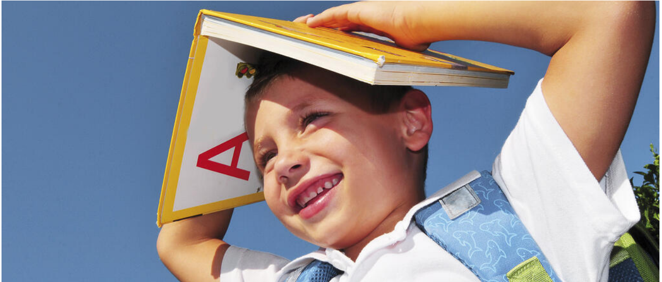
Der erste Schultag – ein besonderer Tag

Im Kindergarten lernen Kinder vieles, an das die Grundschule anknüpft, z. B. mit Papier und Stiften umgehen, zuhören und mit anderen spielen. In der Grundschule erwerben die Kinder zahlreiche Kompetenzen, an die → die weiterführenden Schulen