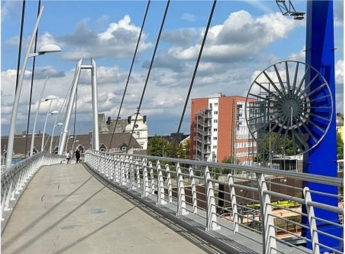
Blick auf die Staatliche Schulberatungsstelle für Oberfranken vom Luftsteg aus

Das Team der Staatlichen Schulberatungsstelle für Oberfranken unterstützt Sie gerne bei unterschiedlichsten schulischen Fragestellungen. Hierfür stehen Ihnen Schulpsychologinnen, Schulpsychologen und Beratungslehrkräfte aus allen Schularten des bayerischen Schulsystems als Ansprechpersonen zur Seite.