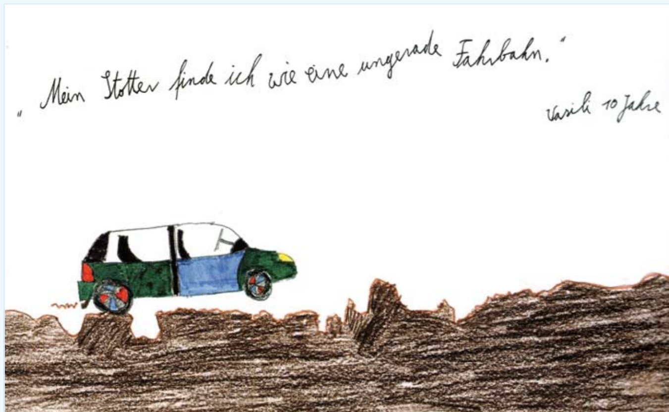
Mein Stottern finde ich wie eine ungerade Fahrbahn. Vasili, 10 Jahre

Stottern ist eine Störung des Redeflusses. Stottern geschieht unfreiwillig: Die Sprechbewegung gelingt vor allem bei höherem und hohem Sprechtempo nicht.