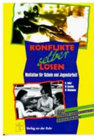
Faller, K. u.a.: Konflikte selber lösen. Mülheim 1996 (Neuaufgabe II/2009)

Streit, ob mit oder ohne körperliche Auseinandersetzung, wirkt belastend im Schulalltag. Er kostet Zeit, belastet die Atmosphäre und erschwert das Lernen. Schüler, die kompetent als Streitschlichter (Mediatoren) ausgebildet wurden, helfen den Konfliktparteien, konstruktive Lösungen zu finden.