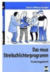
Jefferys-Duden, K.: Das neue Streitschlichterprogramm (Trainingsheft und Lehrerband), Buxtehude 2005

Das Handbuch von Faller u.a. (1996) enthält ein umfassendes, jedoch auch sehr anspruchsvolles Ausbildungsprogramm für Schüler, in dem Grundregeln und Techniken von Mediation und konstruktiver Konfliktaustragung vermittelt werden.