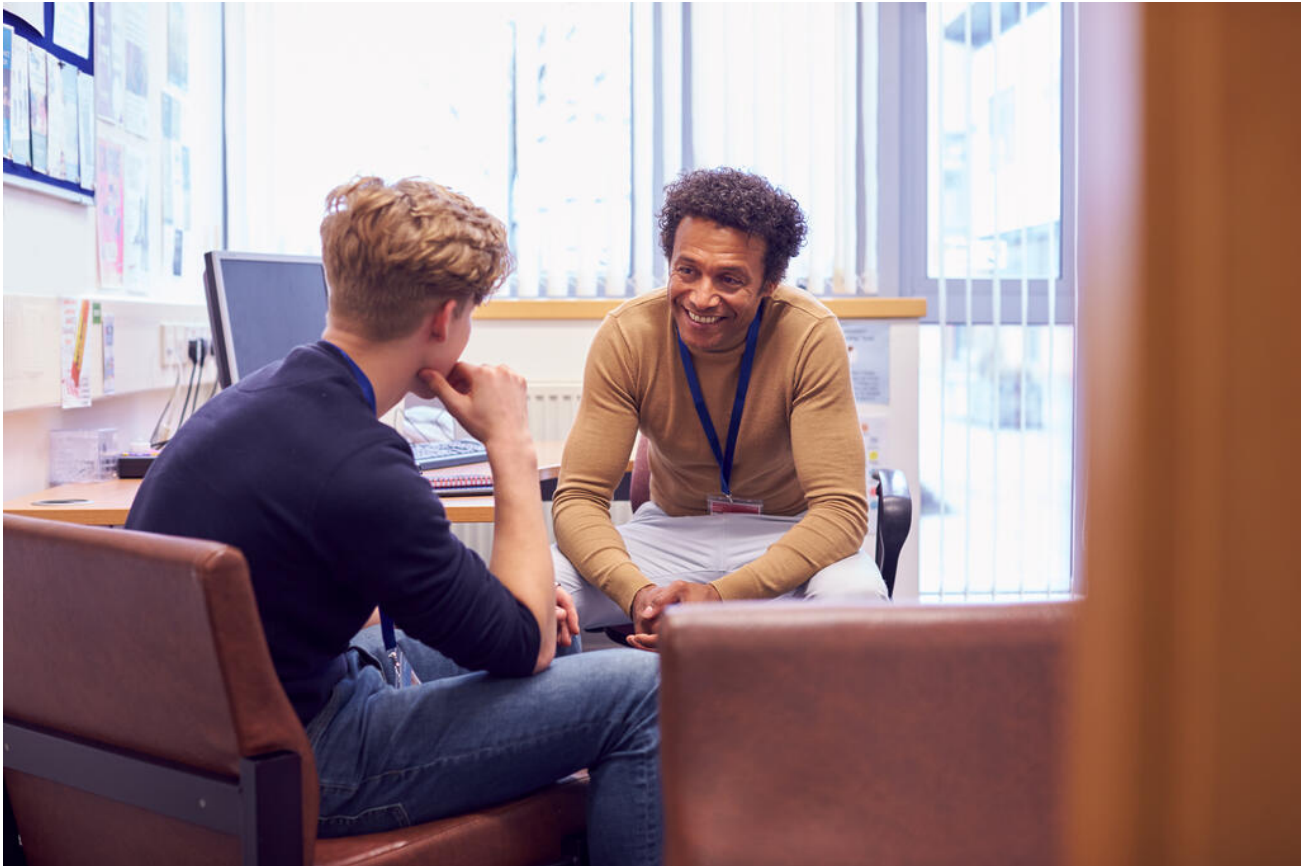
Schülerinnen und Schüler mit besonderer Begabung können sich an der Schule vor Ort beraten lassen