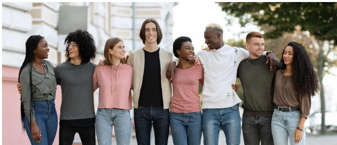
Vielfalt schätzen - Miteinander leben

Weitere Informationen zum Thema Krisenintervention finden Sie auf der allgemeinen Seite zur Schulberatung.