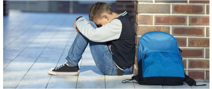
Als Folge von Mobbing ziehen sich Kinder und Jugendliche häufig zurück

Weitere Informationen zum Thema Mobbing und Cybermobbing finden Sie auf der allgemeinen Seite zur Schulberatung.